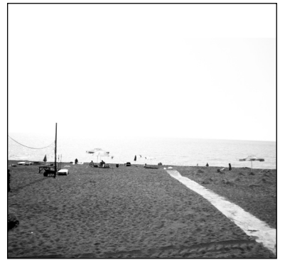
ცენტრალურ შესასვლელში იქნება მოედანი; მოეწყობა საფეხმავლო გზა და ორხლოიანი ველო-ბილიკი; საშხაპეები; მოსასვენებელი ფანჩატურები; სკამები. დაგეგმილია ბულვარის გამწვანება,

ტენდერში გამარჯვებულმა კომპანიამ უნდა მოამზადოს როგორც ურეკის ბულვარის, ასევე მისი მიმდებარე ქუჩების და ბულვარზე გასასვლელის მოწყობის და რეკონსტრუქციის დეტალური საპროექტო-სახარჯთაღრიცხვო დოკუმენტაცია. პროექტის ფარგლებში ბულვარში