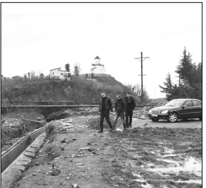
ბეტონის საფარის მოწყობა და ხიდის რეაბილიტაცია. პროექტის ჯამური ღირებულებაა 75 917 ლარი. სამუშაოებს შპს „პალადა“ ახორციელებს.

პროექტის სახელმძღვანელო ღირებულება 205 922 ლარს შეადგენს. სამუშაოები 2 თვის ვადაში დასრულდება. ა. გრიბოევის ქუჩის პირველ შესახვევში მიმდინარეობს მოსამზადებელი სამუშაოები. იგეგმება ასფალტ-