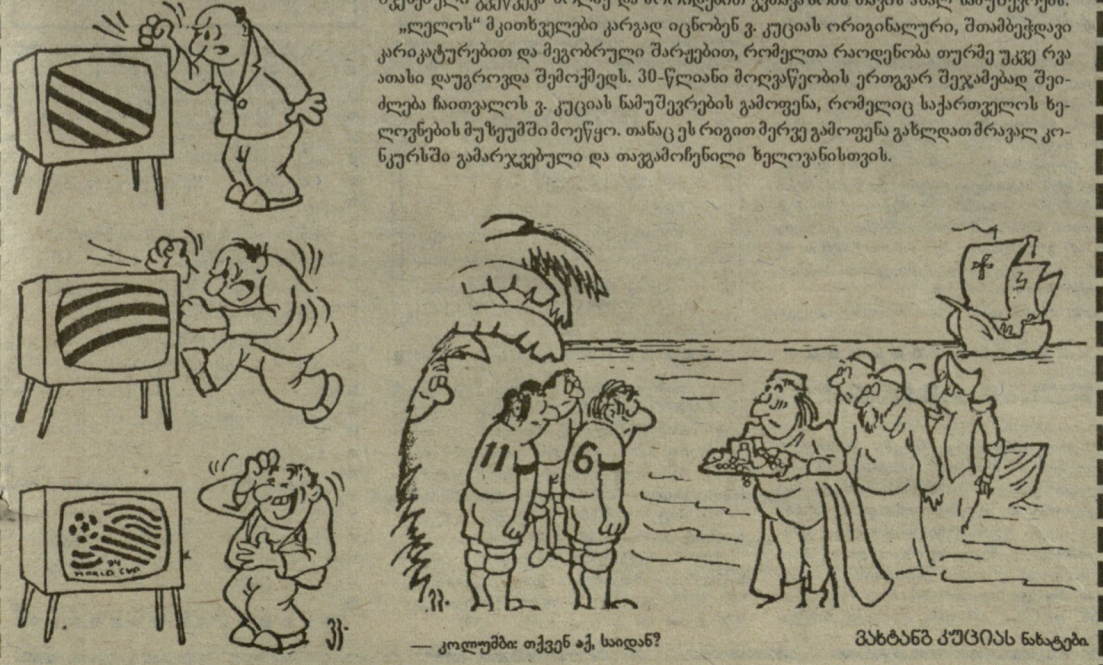
— კოლუმბია: თქვენ აქ, საიდან? მხატვრის მუშაობის ნახატები.

რთული კატაკლიზმები, რაც რუსულ ფეხბურთში მოხდა ზედ მსოფლიო ჩემპიონატის წინა პერიოდში. ყველამ, ვინც კი დაინტერესებულია და საქმეში ჩახვედრილი, კარგად იცის. მტერს და ავს რა ორბიტორალიც იქ სულფვედა ამ უძენლესი შეჯიბრებისთვის მზადების პერიოდში ნაკრების წამყვანმა ფეხბურთელებმა (კირიაკოვი, კოლიგანოვი, კანჩელსკისი, შალიმოვი, დობროვოლსკი და სხვანი) ამბობი ატეხეს, პრეტენზიები წამოაყენეს, საგანგებო მოთხოვნები გააშინდნენ, მთავარი მწვერთხელს პ.საღირისს მკაცრი ბოიკოტი გამოუცხადეს და კატეგორიულად მოითხოვეს მისი გადადგომა. პ.საღირისმა არ დათმო, მას რუსეთის საფეხბურთო კავშირის თავმჯდომარემ, ცნობილმა პოლიტიკურმა ინტრიგანმა ვ.კოლოსკოვმა დაუჭირა მხარი, სისტემაში გამოუცხადდა მეამბოხეებს და რუსეთის ნაკრებიც, ჯერ ისედაც რა იყო, აშკარად დასუსტებული, განახევებული შემადგენლობით გაემგზავრა ამერიკას. გაემგზავრა და რაც გააკეთა, თქვენც კარგად ნახეთ, თანაც ნურავის შეცდომაში შეიყვანეს ქვეყნის ბოლო შეხვედრაში კამერუნელებთან მოპოვებული გამარჯვება, თუნდაც, ანგარიშით 6-1. ეს ისტორიის დონეზე ნათამაშეი მატჩი იყო, ოლეგ სალენკოს სარეკორდო მანქანებელიც მხოლოდ აშლილი ნერვების საფხანი საშუალება განსაზღვრავს მათთვის, ვისაც საამისო სურვილი და განწყობა გააჩნიათ. რუსეთმა კარი გაიჭაბუნა ტურნირის დასასრულს, — ამბობენ ისინი. გაიჭაბუნა და გაიჭაბუნა. ერთ რუმელიმ მატჩში „კარის გაჭაბუნება“ დიდი ვერაფერი გმირობაა, იმ, მერვედღიანალი კი გუნდი