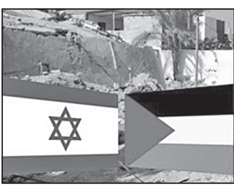
ტირაუი ასევე აცხადებს, რომ კომისიამ დაკითხა ასობით მოწმე და ანალიზი განახორციელა ისრაელის იმდროინდელი ლიდერების „ყველა გამოანათქვამისა“, რომლებიც მტყვევებდნენ „იმის სასარგებლოდ, რომ ირანი არაფატის ლიკვიდაციის უკან იდგნენ“.

1989 წლის 2 აპრილს იასირ არაფატი არარსებული პალესტინური სახელმწიფოს პრეზიდენტად აირჩიეს. 1995 წელს იასირ არაფატი ისრაელის ლიდერებთან იცხაკრაბინთან და შიმონ პერესთან ერთად ნობელის პრემიის ლაურეატები გახდნენ.