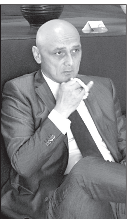
იმიტომ, რომ ასე ვერ იმუშავენს. – როგორ ფიქრობთ, ამ სიტუაციაში, როდესაც პრემიერი ხდება ლარიბაშვილი, იცვლება პროკურორი, რამდენად მალე დაინებება სამართლიანობის აღდგენის პროცესი?

– ახლა ამ ცვლილებებს არ ველი. ახლა გარდამავალი ეტაპია ახალი პრემიერ-მინისტრისთვის და ამ ეტაპზე უკმაყოფილების განქა კოალიციაში მიზანშეწონილი არ არის. ის შეეცდება, რომ ძალაუფლება გაიმყაროს, პოზიციები გაიმყაროს, დალაგოს სიტუაცია პარლამენტში და მერე აუცილებლად გაატარებს ცვლილებებს,