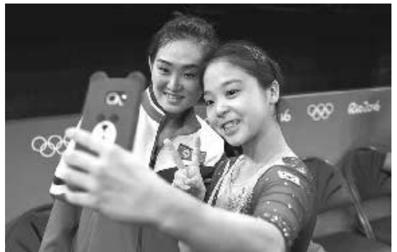
ერევა უცხო ქვეყნების არჩვენებში და გავლენასაც ახდენს.

იუსტიციის მინისტრის მოადგილემ (რომელიც კურორებს სპეცპროკურორ მიუღერის საგამოძიებო ჯგუფს არჩვენებში რუსული კვალის გამოვლენისთვის) განაცხადა, რომ იცინა 13 რუსი პირის ვინაობა, რომლებმაც გავლენა იქონიეს არჩვენებზე. გამოძიების ინფორმაციით, ეს პირები ორივე კანდიდატის შტაბში მოქმედებდნენ. მათივე მოწოდებით ყოფილა დონალდ ტრამპის მომხრე და მისი საწინააღმდეგო მიტინგები (?). ამის შესახებ მიუნხენში რუსეთის საგარეო საქმეთა მინისტრის სერგეი ლავროვსაც დაუსვეს კითხვა, რაზეც მან უპასუხა: „...ვიდრე ფაქტებს არ ვნახავთ, ყოველივე ცარიელი ლაყობაა“. გულგრილი არ დარჩა თავად დონალდ ტრამპი. მისი განცხადებით, რუსეთში ანტიამერიკული