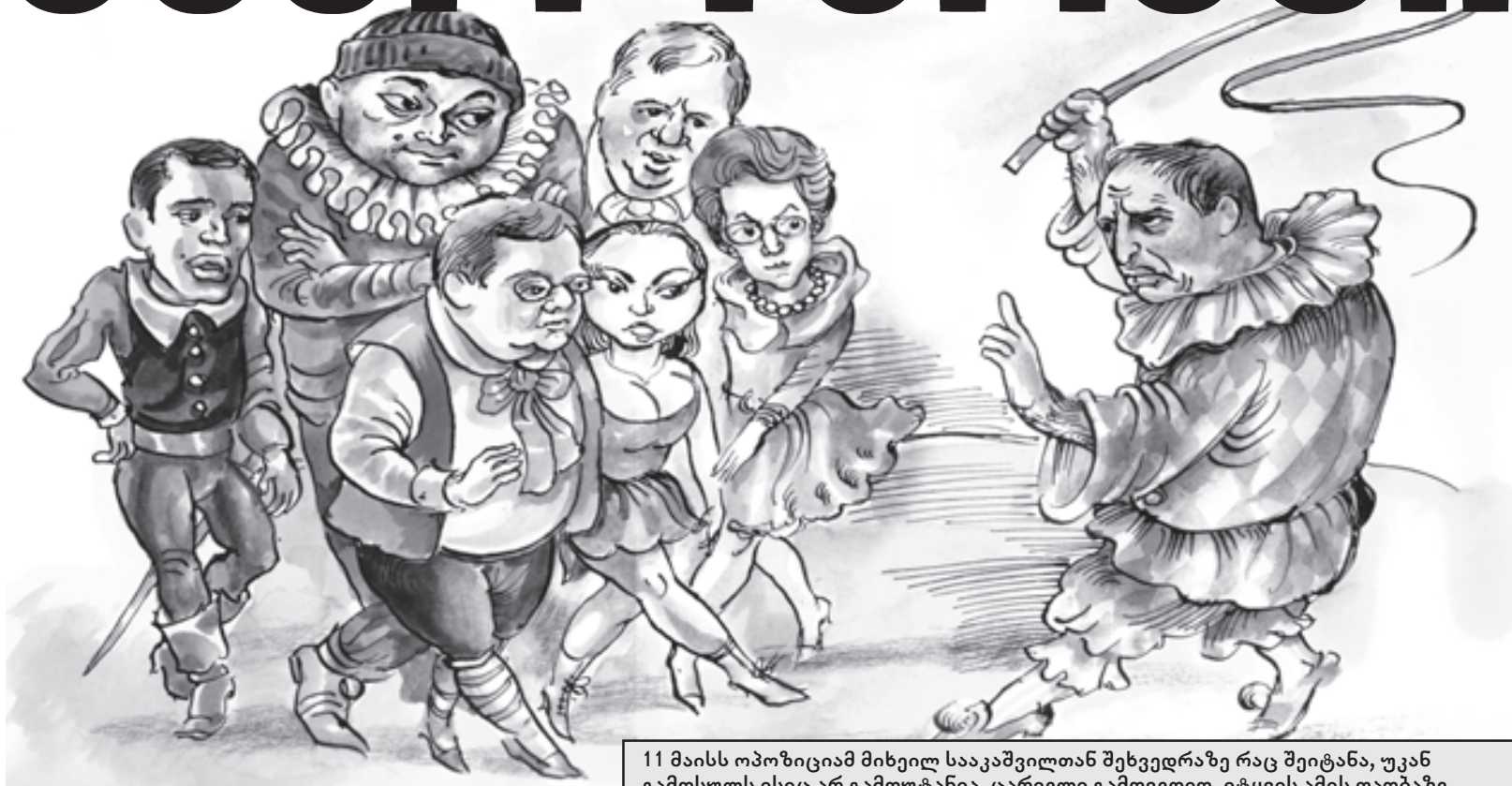
11 მაისს ოპოზიციამ მიხეილ სააკაშვილთან შეხვედრაზე რაც შეიტანა, უკან გამოსულს ისიც არ გამოუტანია. ცარიელი გამოვედიო, იტყვის ამის თაობაზე ლევან გაჩეჩილაძე. ყველამ იცოდა, რომ დემოკრატიის ამ ფესვის დემონსტრაცია ასე დამთავრდებოდა და მაინც ეახლნენ მიხეილს. რატომ?