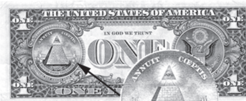
უცნაური პირამიდის ქვეშ ნარწარაა: „ახალი მსოფლიო წესრიგი“

შლიკმა გარდაცვალებამდე (არავინ იცის — თავისი სიკვდილით, თუ ვინმე დაეხმარა) 2 მილიონზე მეტი ტალერი გამოუჭადა. მეტი ხელსაყრელი ზიზნესი იყო. კარლ მეხუთემ მაშინვე ჩამოართვა დაობლებულ ოჯახს მონეტების ჭედვის