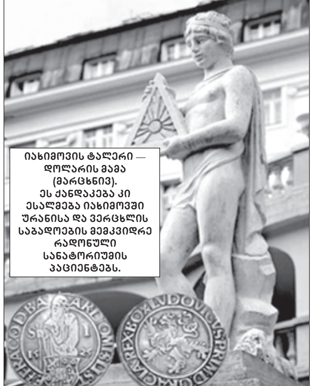
იახიმოვის ტალერი — დოლარის მამა (მარცხენი). ეს ქანდაკება კი ესალმება იახიმოვში ურანისა და ვერცხლის საბადოების მამაკვიდრა რადონული სანატორიუმის აპციინატაზს.

დღეს ბევრს საუბრობენ რუზველტის „ახალ კურსზე“, რომელმაც იხსნა ქვეყანა დეპრესიისაგან. სინამდვილეში კი ის ლეგენდარული New Deal ითარგმნება სხვაგვარად — ახალი გარიგება, რომელიც დიდ სახელმწიფოსა და დიდ ბიზნესს შორის დაიდო. დიდ ბიზნესს, იმისათვის რომ ყველაფერი არ დაკარგულიყო, ევალებოდა მომსახურების გაყოფა. ამ ახალი გარიგების ნამდვილ მიზანს, რომელიც სიმბოლურად დამოფრული იყო 1928