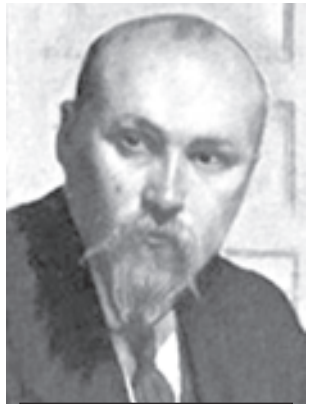
ამერიკულ დოლარზე საიდუმლო სიმბოლოები რუსმა მხატვარმა ნიკოლაი ჩარინმა დახატა

გზა მსოფლიოსა თქვენი მოსაზრებები? დაგვიკავშირეთ: 38-41-97, ან მოგვწერეთ: info@geworld.net