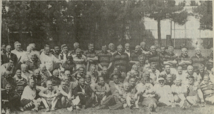
ქართული რაგბის ნაკრები, სპორტმწოდ და სიდალა