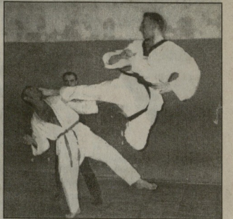
საქართველოს სახელი დაცემისთვის შავი შუკებისა და მისივე დასახლებაში...