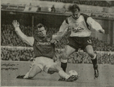
არსენალი - ლივერპული

ტორინო - უდინეზე 3-1 1-0 ლუკაჩი (27 პენ), 1-1 იაკვი-ბატი (45), 2-1 მასპერი (69), 3-1