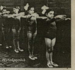
საქართველოს ოლიმპიკი მხარდობის წევრები