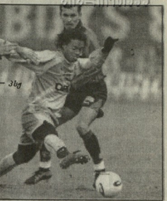
ლილი - ლიონი