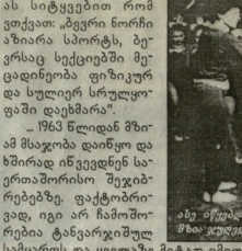
საქართველოს ოლიმპიკი მხარდობის წევრები