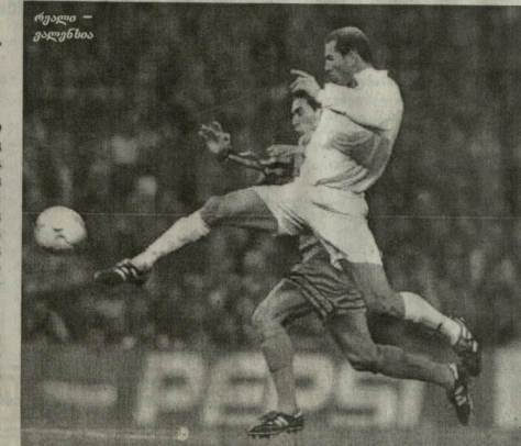
სახაოშა - გულსტანი

სახაოშა - ესპანოლი 0-0 ვალადალიდი - დემოკრატული 3-0 შარკიანი (31), ფრანალი (32), ფერნალი (58).