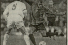
სელა - იმურჯი