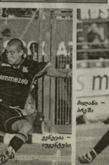
აჯაფცი - ტენტიფი