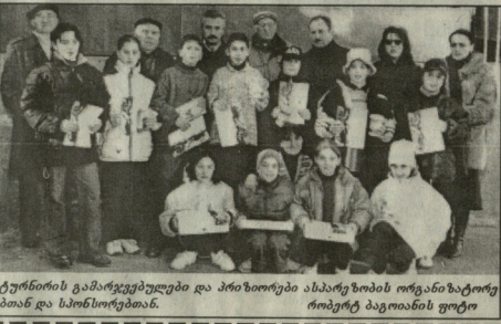
ტურნის გამარჯვებულები და პრიზორები ასპარეზობის ორგანიზატორთან და სპონსორებთან.