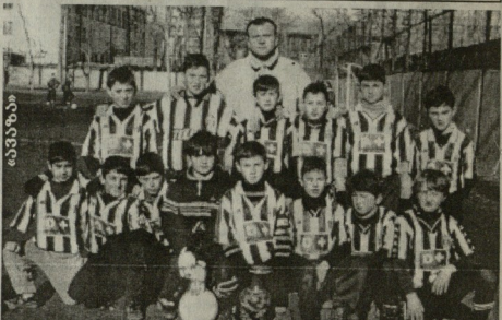
სწავლებლის ბავშვთა ფეხბურთის გუნდი