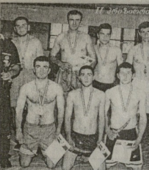
ფოტო მდიდრობა მდიდრობისა