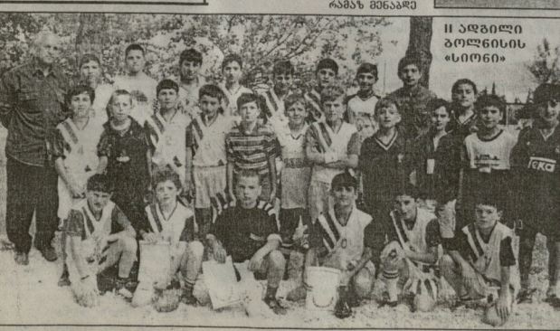
II ადგილი - ბილინის «სიონი»