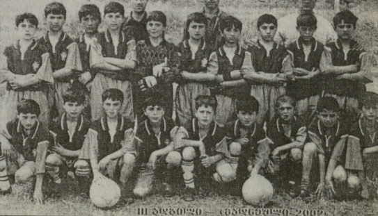
II ადგილი - ბილინის «სიონი»