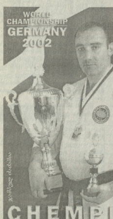
World Championship Germany 2002

20 წლისა საქართველოს უმუხე ფედაციის მიერ ორგანიზებულ მეთორეოფულ ნამპობიანე მუწონიელ ოთალი დუნდუნი ხელმძღვანელობით პირველობა მოიპოვა. იმევე წელს აღმოსავლური ორთაბრძოლების ხელეუენების უნივერსიტეტში შედის. მალე რომსტრეში გაეადიდა სასწავლებლად, იქ შექს ოსტატობას და აი, 1994 წელს რუსეთის ფედერაციის ჩემპიონ ხდება სტეპარიალში. მომდღენი წელს საერთაშორისო კატეგორიის