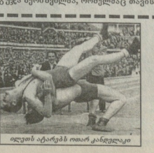
დღის ბავშილხან ოთარ კანდელი

მათი ხელმძღვანელები, ალბათ, ეგროხად მიმოხილეს თავ უზახსილად და მასხელებდ თუნდა იმით, რომ თეთი ეს ტურნირები სპორტის ორგანიზაციის დედა, ეს ახალი კლუბი კი შეხანსხავად მაქურა ამ სიერცემში როგორც სახანაბროვი თვალსახინთ, ისე შინააშორივად.