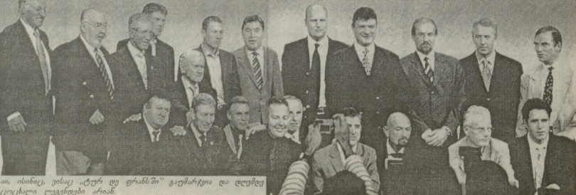
არ იბილი, ვახოფი გვიბახუთი და დღმუწე ცოცხალი ლეველები არან.