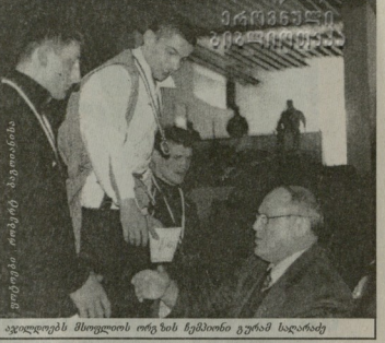
ავალიტის მსოფლიოს იტალიის სხეპინი გეპან სადარე