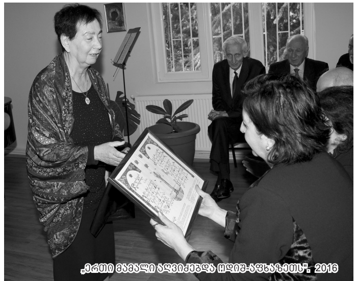
„ერთი მამალი ზღვიჰეზა მღიჰ-აფხაზეთს“, 2016