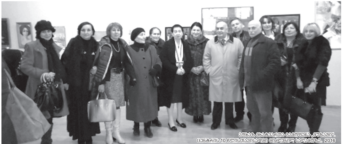
ჯანჯა მსატყვართა გამიფანა „მუზაში“. ცენტრის 10 წლისთავისადმი მიძღვნილ სარგებზე. 2016