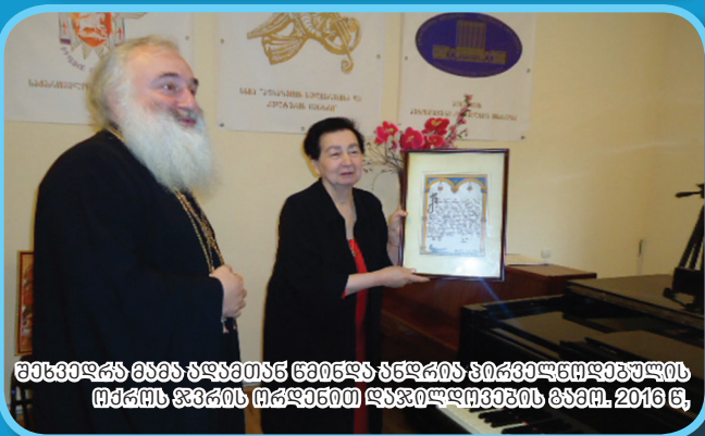
შენვებდას მასა აღმართ დენტის პირველწილადკლასის მედიის ფონის მსახურით დაჯილდოების ბავში. 2016 წ.