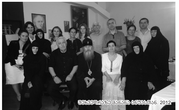
შეხვეღაჰა მანანს ზნუსთია. 2012