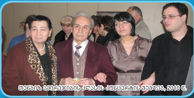
თანხვეწიანი კლასის მენეჯერის შეხვეწა, 2010 წ.