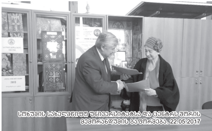
სოსხვის სახელმწიფო უნივერსიტეტსა და ცენტრს შორის მემორანდუმის გაწმობა. 22.05.2017

„გულის სახსოვარი“ კიდევ არაერთხელ გამოიციემა, რადგან იგი წარმოადგენს არა მარტო აფხაზეთის კულტურის მცირე ისტორიას, არამედ, ფაქტობრივად, აფხაზურ-