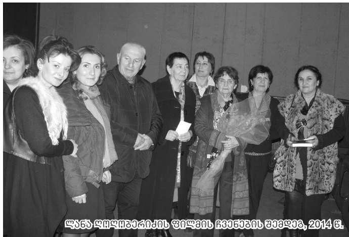
ლანს დღეღმეპიჰის ფიღვის ჩვენების შედეგა, 2014 წ.

ქალბატონ სვეტლანას არასოდეს გაუყვია აფხაზეთის ცნება საქართველოსაგან და პირიქით. „აფხაზეთი საქართველოდ და საქართველო აფხაზეთად“ - ასეთი იყო მისი