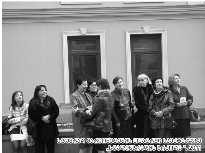
სტუმრალ მამიღმეღვის თეატრის სეჰტაჰაჰა „სტალინგრაღის ჰჰამლა“. 2011