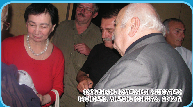
მცნობის საფლავზე ანთიპური სანთელი. ფილის ჩვენება, 2012 წ.