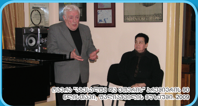
თბილის "ზაზაშვილი და თბილისი" პრაქტიკის 90 წლისთავი, ფაქტობრივი მუშაუმი. 2009