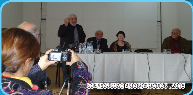
საღმრთაო დენტობა . 2015