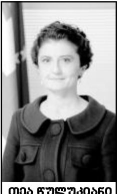
თია ტუშკიანი საქართველოს იუსტიციის მინისტრი