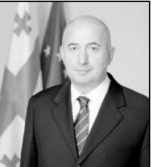
ზვიად რომაძე საქართველოს სახელმწიფო მინისტრი რეინტეგრაციის საკითხებში