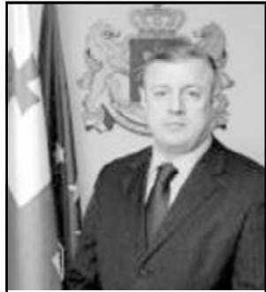
გიორგი კვირიკია საქართველოს ეკონომიკისა და მდგრადი განვითარების მინისტრი, ვიცე-პრემიერი