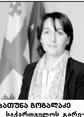
სათუნა გომალაშვილი საქართველოს გარემოსა და ბუნებრივი რესურსების დაცვის მინისტრი