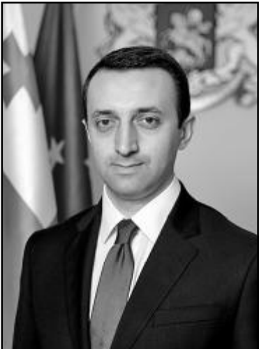
ირაკლი ლარიბაშვილი საქართველოს პრემიერ-მინისტრი

მთავრობისთვის ნდობის გამოცხადების თაობაზე პარლამენტის მიერ მიღებულ დადგენილებას ხელი მოაწერა პარლამენტის თავმჯდომარე, რაც პრეზიდენტს გადაეგზავნა.