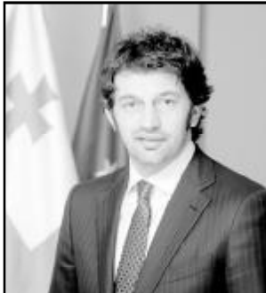
კახა კალაშვილი საქართველოს ენერჯეტიკის მინისტრი, ვიცე-პრემიერი