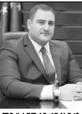
ალექსანდრე შიქიძე საქართველოს შინაგან საქმეთა მინისტრი