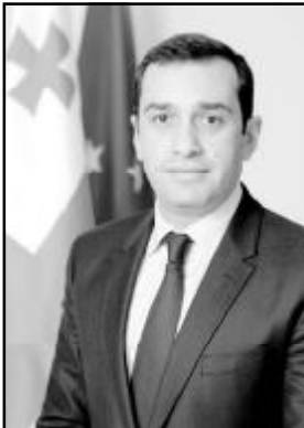
ირაკლი ალბასანი საქართველოს თავდაცვის მინისტრი