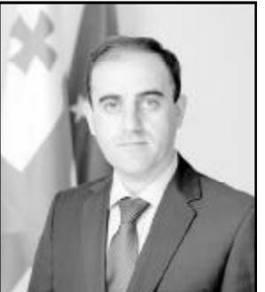
დავით ნარმანიძე საქართველოს რეგიონული განვითარებისა და ინფრასტრუქტურის მინისტრი