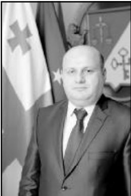
ნოდარ ხადური საქართველოს ფინანსთა მინისტრი