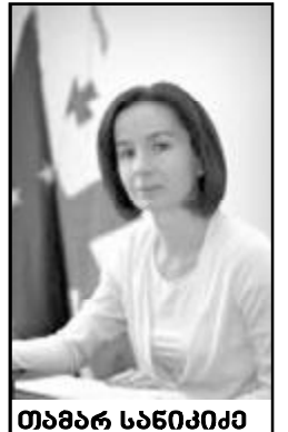
თამარ სანიკიძე საქართველოს განათლებისა და მეცნიერების მინისტრი