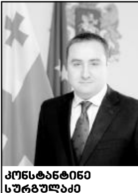
კონსტანტინე სურგულაძე საქართველოს სახელმწიფო მინისტრი დიასპორის საკითხებში