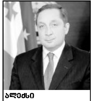
ალბი პატარიძე საქართველოს სახელმწიფო მინისტრი ევროპულ და ევროატლანტიკურ სტრუქტურებში ინტეგრაციის საკითხებში