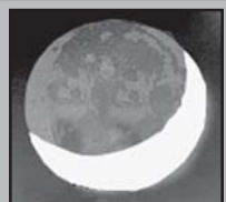
ამოღის 04.27 ჩაღის 19.40