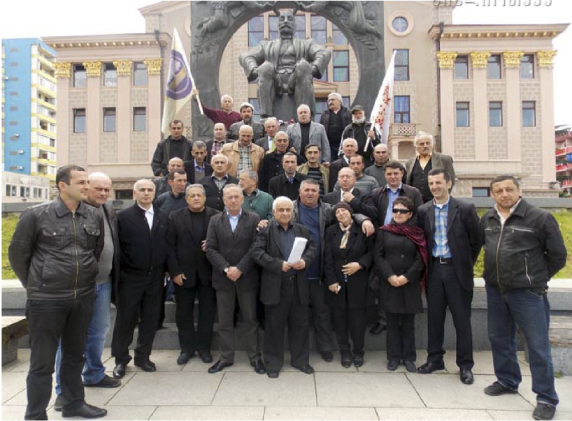
Участники «кровавого» 26 мая 2011 года. Члены «Народного собрания» Аджарии.