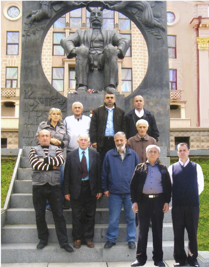
Участники «кровавого» 26 мая 2011 года. Члены «Народного собрания» Аджарии.