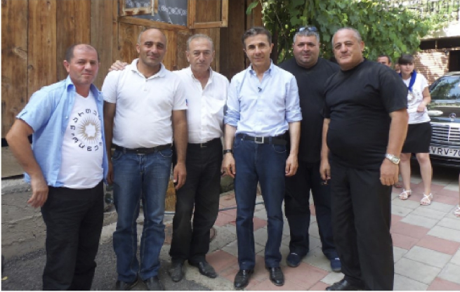
Гос. Бидзина Иванишвили вместе с членами «Народного собрания». Слева направо: Роланд Хозреванидзе, Давид Самнидзе, Цискаридзе Гогитидзе, Бидзина Иванишвили, Лаша Мсхиладзе и Бичико Болквадзе. 5 Августа 2012 года. Пос. Хуло.