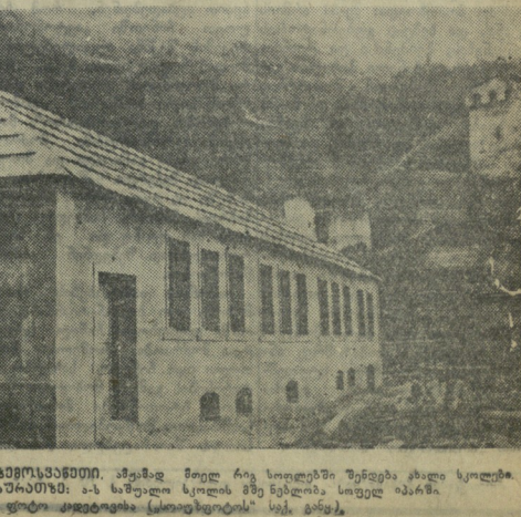
ახალი სკოლის შენობა. უკვე იმდენად მკაფიოდ დაუფიქრებია, რომ კახეთში უნდა არის სკოლა?

სსსრ-ის ფილიალის გზავნა. უკვე იმდენად მკაფიოდ დაუფიქრებია, რომ კახეთში უნდა არის სკოლა? უკვე იმდენად მკაფიოდ დაუფიქრებია, რომ კახეთში უნდა არის სკოლა?