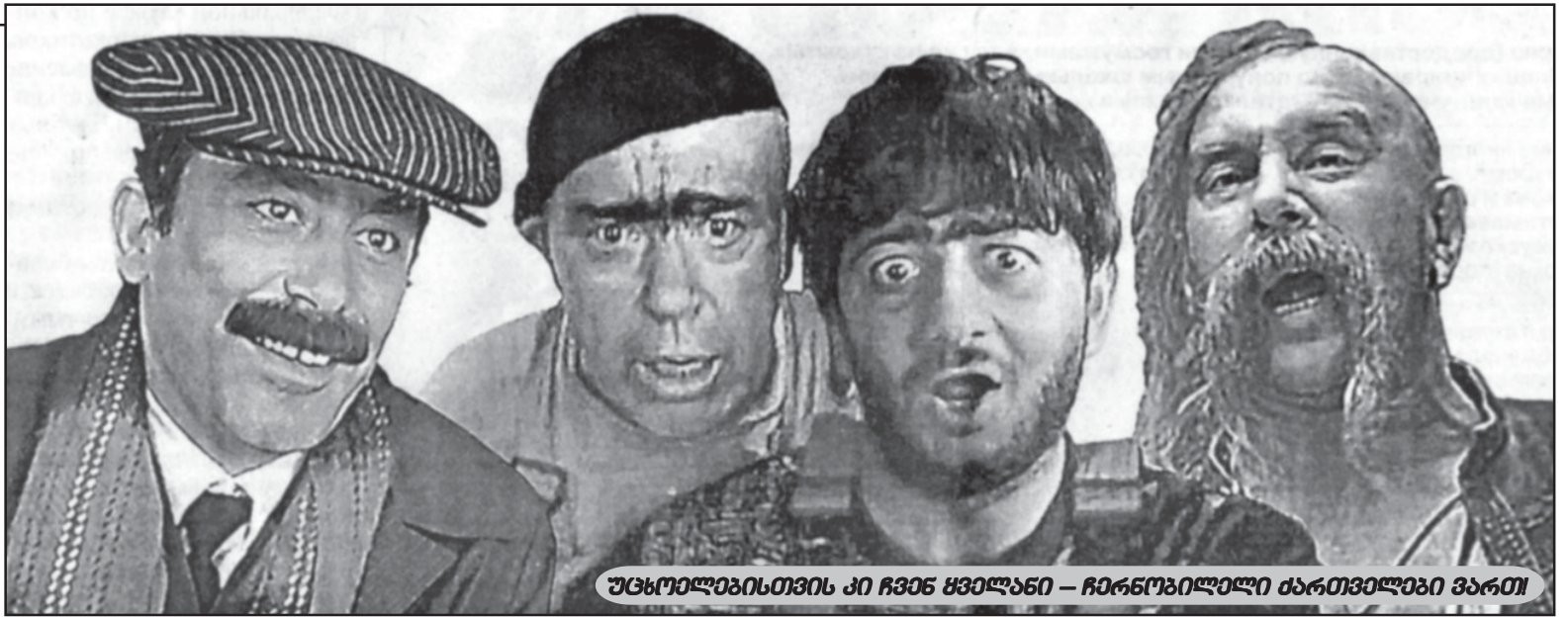
უცხოელისთვის კი ჩვენ ყველანი - ჩი ჩი ჩი