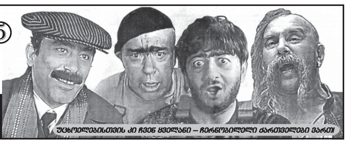
უცხოელბისთვის კი ჩვენ ყველანი – ჩარნობილელი ძარბივლები ვართ!