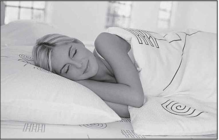
მასხანათებელ გვერდით ეფექტებს, მაგრამ ამ დროს გვეხებარება დავიძინოთ მალე და ალარ გავპვლიძიოს ღამეში ასჯერ.