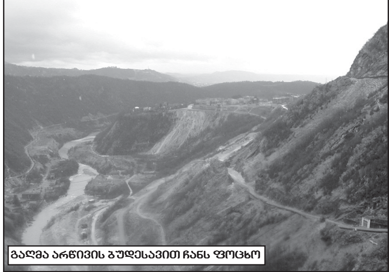
გაღმა არსების გულისხვით ჩანს ფოცხო