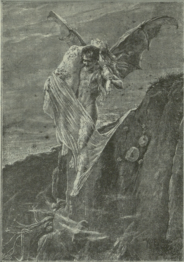
ს ა ბ ტ ა