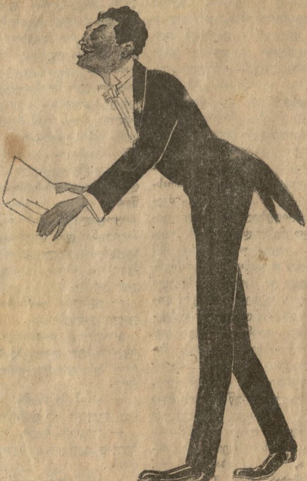
ვანო სარაჯიშვილი: „...შემიბრალე, გენაცვალე!“