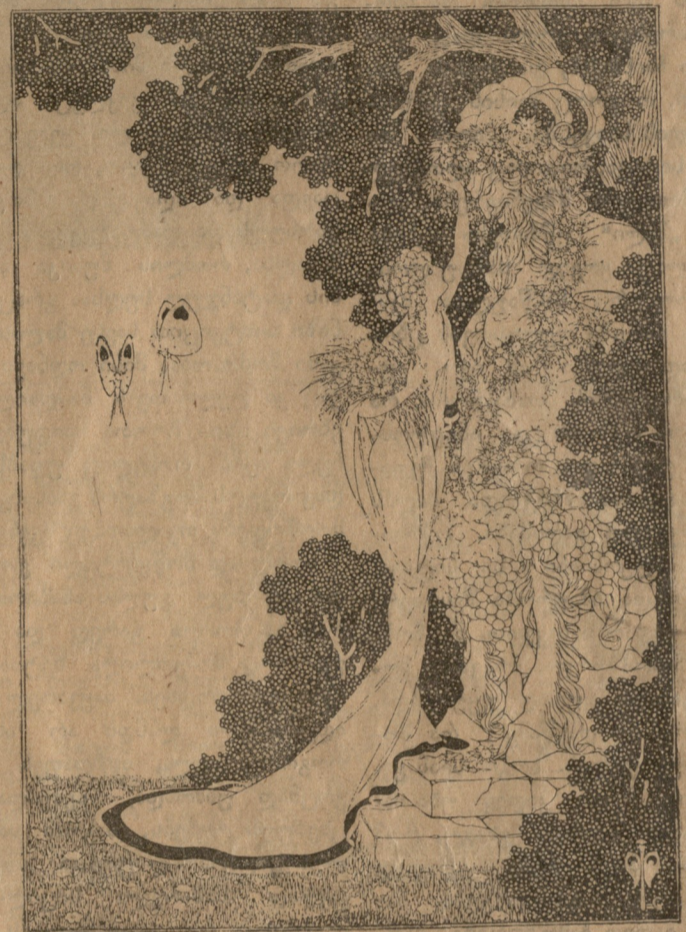
მხვერპლმეწირვა. ნახატი ს. ლაღივისა.