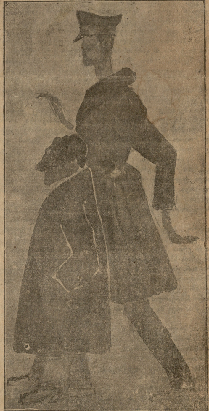
ერისთავი და შავარდნაძე: „ფრესკებისაკენ!“