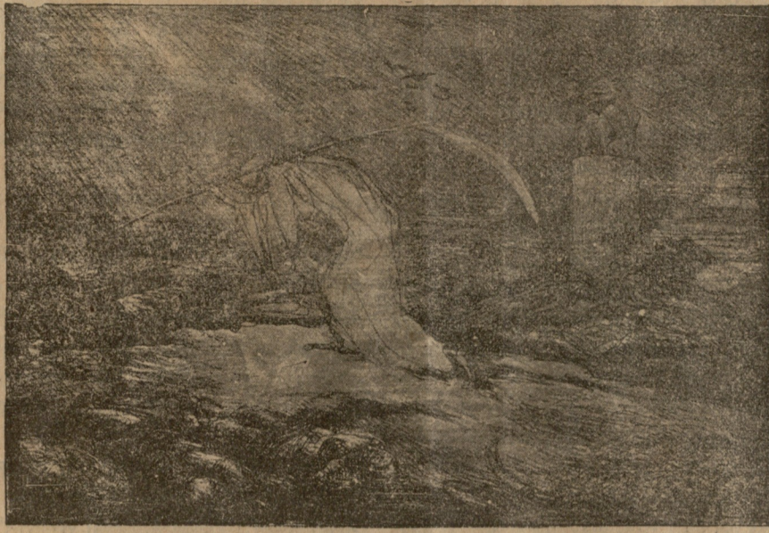
სიკვდილი ბრძოლის ველზე.

შემოიფარგლოს. მარტივი სიკვლეუცე — იქ ქალთა უმალლესი ხელოვნების დევიზი!