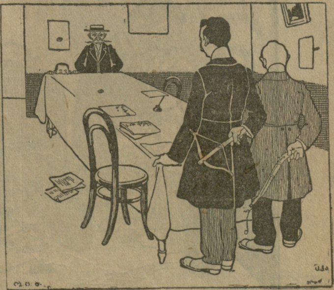
„საქარ.“ წარმომადგენელნი.—ბატონებო, ჩვენ უნდა გავსწორდეთ „განსაზღვრული წესით“. გაძღვეთ 24 საათის ვადას!