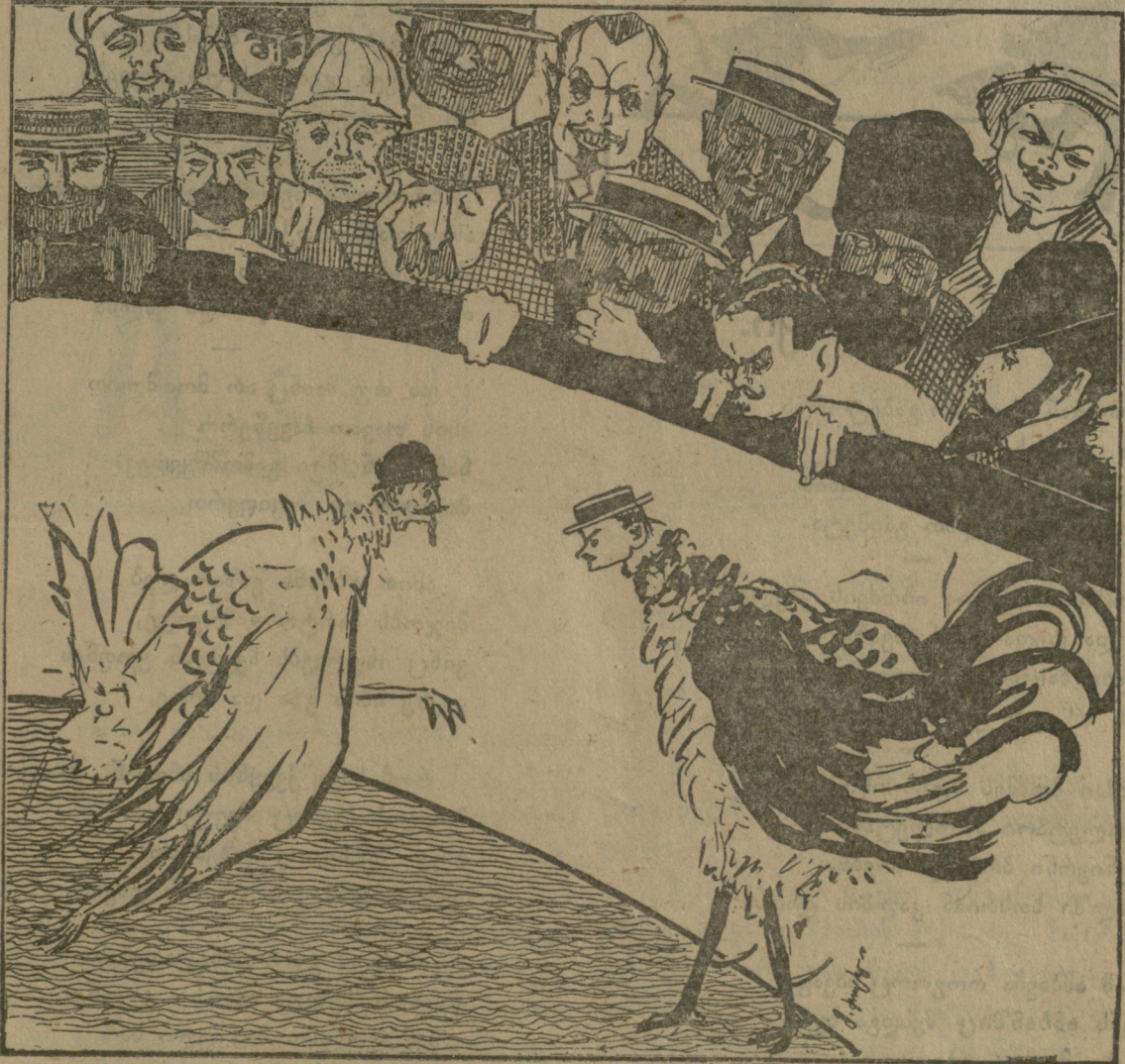
საორტის მოყვარულნი აღტაცებით მოელიან ამგვარ სანახაობას.