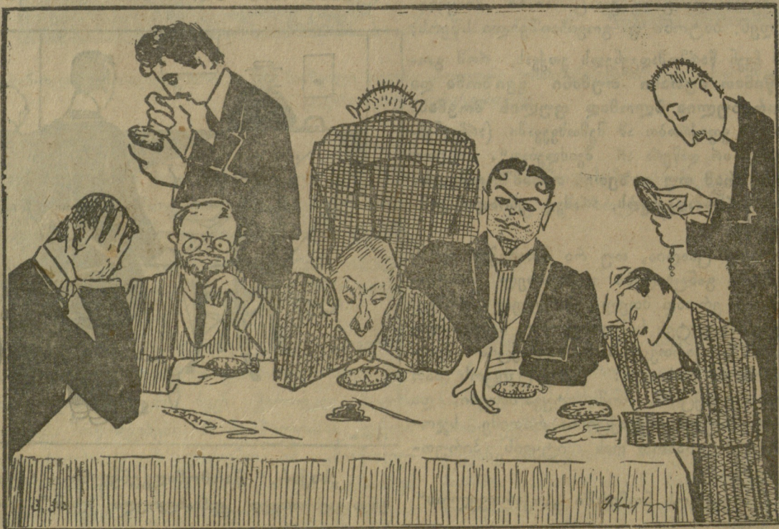
„საქართველოს“ მესვეურნი საათებს მისჩერებოდენ და ჩვეულებრივის მოუთმენლობით ჩასცქეროდენ, თუ როდის შესრულდება დანიშნული ვადა.