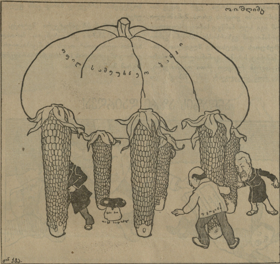
სამეურნეო ბანკში თავმჯდომარის ალაგი განთავისუფლდა!