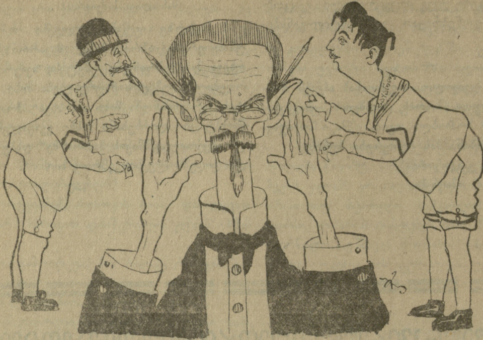
სახ. ფურცელი ბ-ნო შლინგ! გუშინ წინ „საქართველომ“ გამა- ჯავრა. ერთი იმისი კარიკატურა დამიხატე „საქართველო“ ბ-ნო შლინგ! გუშინ „სახალხო ფურცელმა“ მაწ- ყენინა, ერთი კარგათ გამომიჭიმე კარიკატურაში.