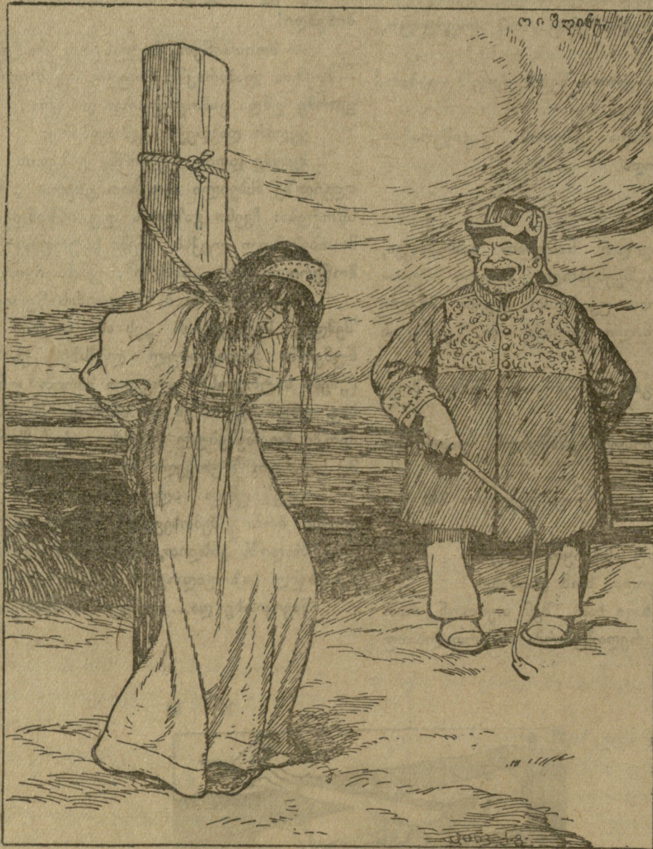
წამების ბოძზედა განაკრავს სტანჯავდენ ბნელეთის ქაჯები