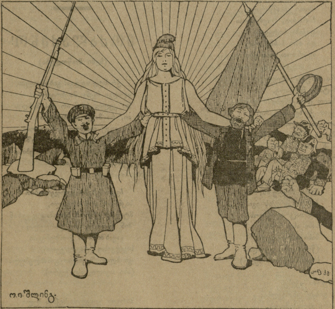
დიდების კვარცხლბეკზე მდგომარეს უღვანან გვერდთ პირმშო ვაჟები.