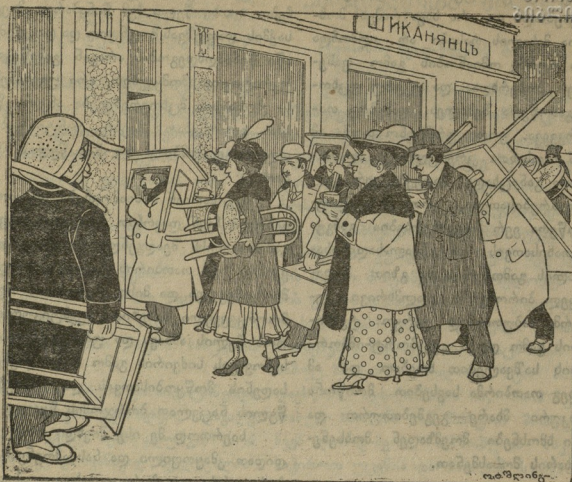
როგორ იღებენ პოზიციებს „ძმურ ნუგეშში“.