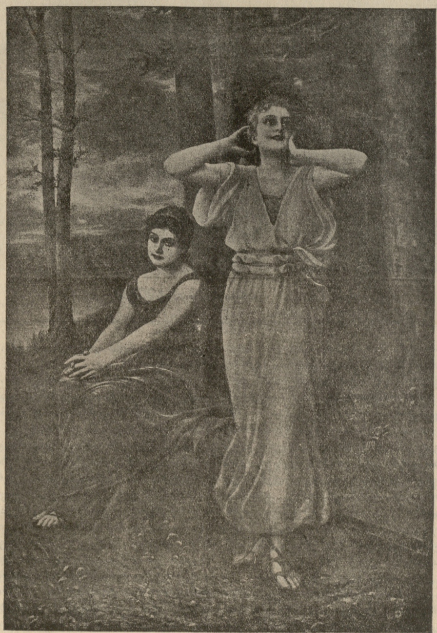
ი მ ე ლ ი