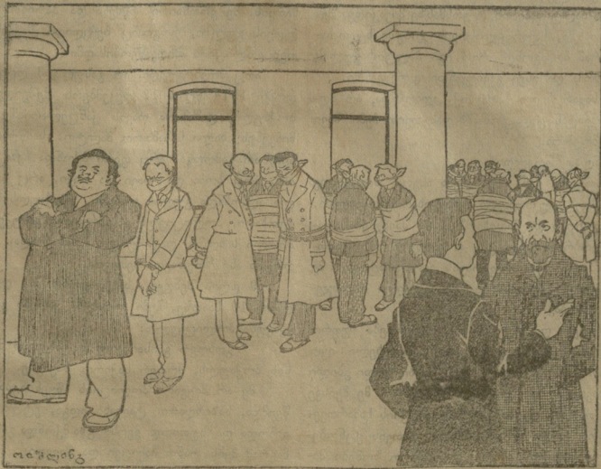
ო. ლ. ანტ.

ზარმუშ, ეს რა ანბავი ხახელმწიფო სათათბაროში? მ. ჩხიშიძე. ახალი ანბავია. პროგრესულმა ზღოქმა ბოიკოტი გამოუცხადა მარ- კოვ, მეორეს და რომ თ. ვისი სიტყვა ახლა მაინც მოიყენოს სხსრულდში ეს ეშაქუ- რი ხეჩხი მოიგინა.