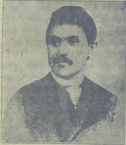
ცნობილი პროვოკატორი ანუგი.