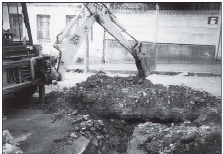
რად გამოხატული მომხრეობით უარი ხსენების ბაერტიანებას – „საქართველოს წყალს“ შეუერთდა.

რადგან ზამთრის უკვე თქმულ უამრავ სხვა დაბრკობას და გათვლილი გეგმის მიხედვით გარეული გარემოების დაბრკობა, ძველი წარმოსადგენი არ არის, რა გეგმიური მოსახლეობას, როცა წყალმომარაგებისთვის დახარჯული ელემენტარული პრობლემა გიუზავით აღარ გადაიხდის.