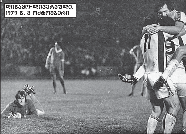
დინამო-ლივერპული. 1979 წ. 3 ოქტომბერი.

მხოლოდ ერთი ვიტყვი, რომ სპორტის ისტორიაში არც მანამდე არც მას შემდეგ თბილისში დივიდუალები არ არიან, რომლებიც ჩვენს გუნდს ახლა უკვე 3:0 გაანადგურეს.