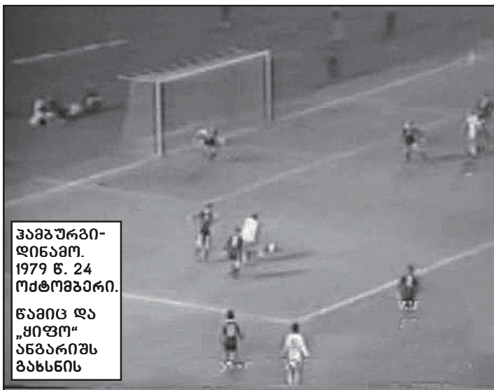
ჰამგურის დინამო. 1979 წ. 24 ოქტომბერი. წამიც და „ყიფი“ ანგარიშს გახსნის

კარა უმცირესობაში იყვნენ, რომ იტყვიან, ხელი ჩაიჭინეს. დანარჩენები კი იმდენად, თუმცა ამსაკვატიოსთა გამო, გინც გარკვეული შიშით ველოდით პირველ მატჩს, რომელიც დინამოს სტუმრად უნდა ჩატარებოდა.