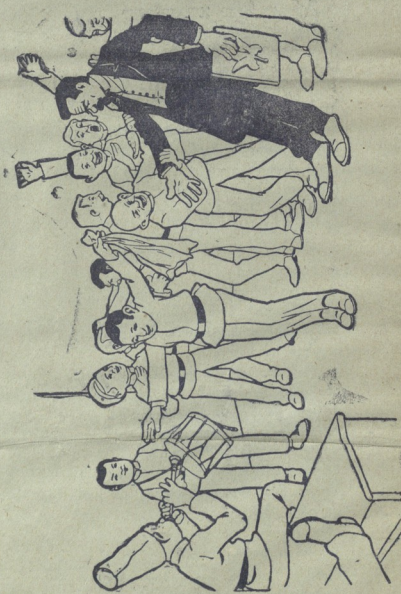
ჩვენი „უზნენი კები“.

„ს ა თ ა ე ლ ს“. თქვენს ბოლონდელს გამოგზავნილს კუპლებებს ვერ დამებედავთ, რადგან პირველმა კუპლების იმ აღგიღმა, რომელიც ეხებოდა ვლ. ბ.ს, მეტად უსიამოვნე- ბა გამოიწვია. როგორც სწინს არავითარი იმგვარი არ მომ- ხდარა, რასაც თქვენ იმ პირს აზრალეზით და რალად კერ- ძო ინტერესებით გამოჰქმენიათ. მოიწერეთ განმარტება დაუ- ყვებელივ.