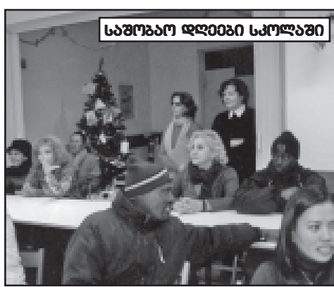
საშობაო დღეები სკოლაში