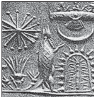
ბავთი ბავთისა და ჩვენი ბავთი.

ბავთი ბავთისა და ჩვენი ბავთი. ბავთი ბავთისა და ჩვენი ბავთი. ბავთი ბავთისა და ჩვენი ბავთი. ბავთი ბავთისა და ჩვენი ბავთი. ბავთი ბავთისა და ჩვენი ბავთი. ბავთი ბავთისა და ჩვენი ბავთი. ბავთი ბავთისა და ჩვენი ბავთი. ბავთი ბავთისა და ჩვენი ბავთი. ბავთი ბავთისა და ჩვენი ბავთი.