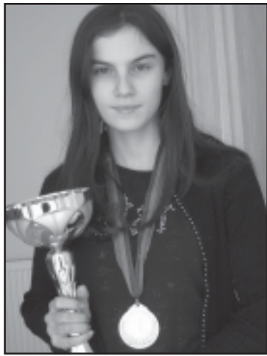
სურა ავიდა. მეორე ადგილი ჩააგდო მკლავსნობელებს...