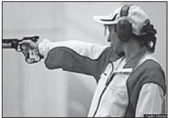
ძარბაზი მსროლელი ახლა მიუხედავად საერთაშორისო ტურნირისთვის მოემზადებინა...