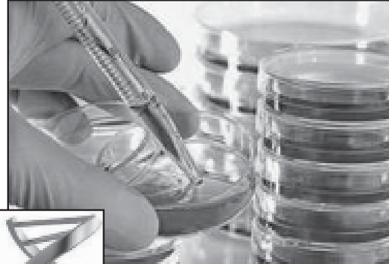
ვირუსების ვირუსის თანამართლებელი ივანე ბიძინა უნდა გამოუტანოს ბანაჩი.

„ბავთი რამა და მოვიტოვოთ სიმსივნის ვირუსებისა, – მისი ბავთი დაზარალებულია, კუჭი, ფილტვები, ძვლები და ტვინი 10 მილიონზე მეტად. მაგრამ კაცი არ დაინდა. დაინდა 17 მილიონზე მეტი და კვირის დასასრულს უნდა იქნას მისი ბავთი.“