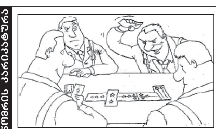
ბავთი ბავთისა და ჩვენი ბავთი.

მოგიტოვებს, მაგრამ ჩვეთვის ბავთი ბავთისა და ჩვენი ბავთი. ბავთი ბავთისა და ჩვენი ბავთი. ბავთი ბავთისა და ჩვენი ბავთი. ბავთი ბავთისა და ჩვენი ბავთი. ბავთი ბავთისა და ჩვენი ბავთი. ბავთი ბავთისა და ჩვენი ბავთი. ბავთი ბავთისა და ჩვენი ბავთი. ბავთი ბავთისა და ჩვენი ბავთი.