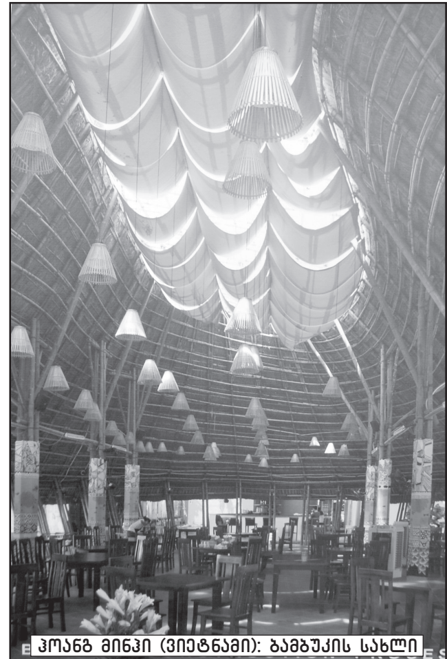
ჰოანგ მინჰი (ვიეტნამი): ზამბუკის სახლი

წლებადელი ტრინალეს შეიძლება „იტალიური ტრინალე“ ეწოდოს. პროექტებისა და რეალიზაციების ნომინაციაში 15 პრემიიდან 7 იტალიელ არქიტექტორებს ერგოთ, ხოლო არქიტექტურული ნიგნების კონკურსის 4 პრემიიდან 2 იტალიელებმა და-