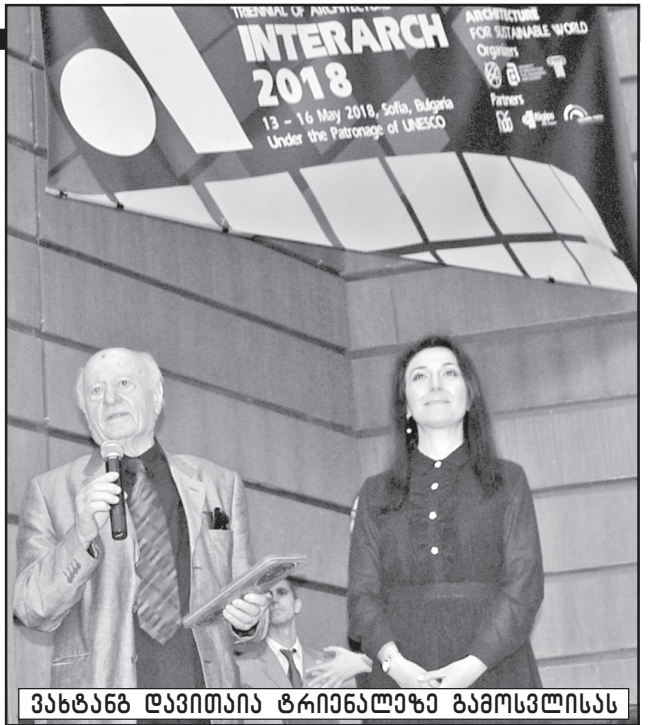
ვასტანგ დავითაია ტრინალეზე გამოსვლისას

არქიტექტურის საერთაშორისო აკადემიის ასამბლეაზე მონაწილეობის მისაღებად და ტრინალეზე საავტორო გამოსვლისათვის მიწვეული იყო ამ აკადემიის აკადემიკოსი, საქართველოს ტექნიკური უნივერსიტეტის არქიტექტურის ფაკულტეტის პროფესორი, რუსთაველის პრემიის ლაურეატი ვასტანგ დავითაია . დღეს ბატონი ვასტანგი ჩვენი გაზეთის სტუმარია.