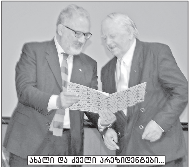
ახალი და ძველი პრეზიდენტები...