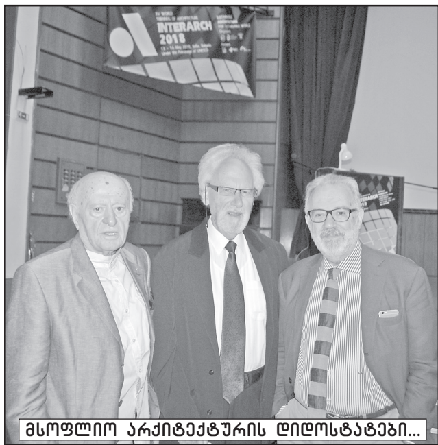
მსოფლიო არქიტექტურის დიდოსტატები...

ტრინალეზე მსოფლიოს დედაქალაქები და საელჩოები ანეხებენ თავიანთ პრემიებს. ჩემთვის სიურპრიზი იყო ბულგარეთში აზერბაიჯანის საელჩოს პრე-