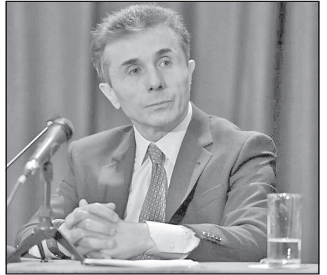
წერილი? ერთს მაინც ექნება? მთავრობაში?..

„ყველა უბედურება იქიდან მოდის, რომ პოლიტიკოსები არაფერს არ კითხულობენ“ , — უმბერტო ეკო.