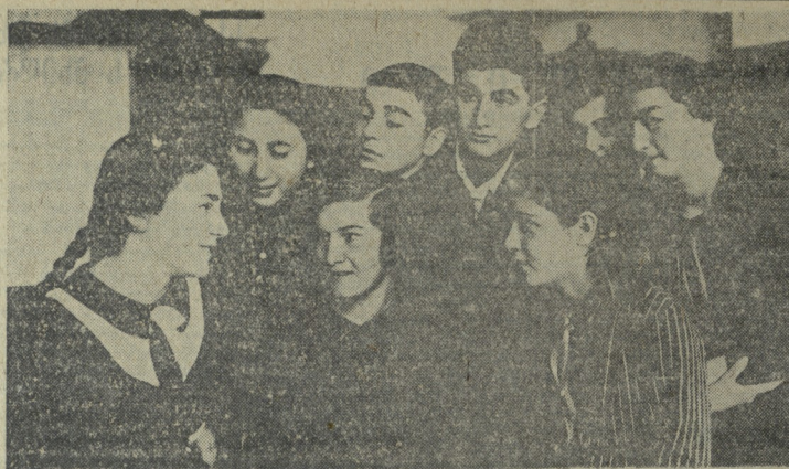
ორდენისანი მოწვევით უფრო განვითარებული ახალგაზრდა თაობის ცხოვრების ყველაზე ზედწილად — კრედიტში