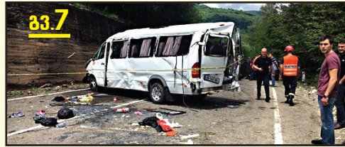
გომბორის ტრაგედიის დეტალები

„ვაივა, დავიღუპეთო, იყვირა მძღოლმა, მეორე ბრუნვა მე და დედაჩემი ფანჯრიდან გვისროლა“