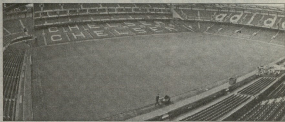
ჯერჯერობით, სტეფანო ბრიჯე...