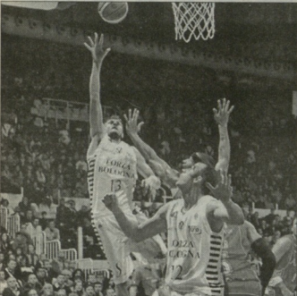
საჩინოს ამ სრულად მოხსნა ვერ უნა