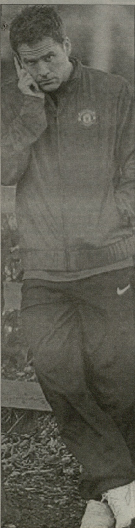
მაიკლ უეინი დაბიო კაპელის ზარს ელვდება

«აი, სამსაბურთის თობაზე ეინხენბან ტრო-ტურზე რომ მოლაპარაკება მასწავლანობს ქვეყნიური საქციელი ვერ იქნებოდა».