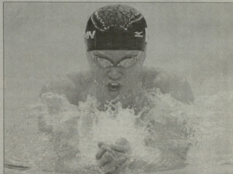
დაეარსება დაეარსება დაეარსება