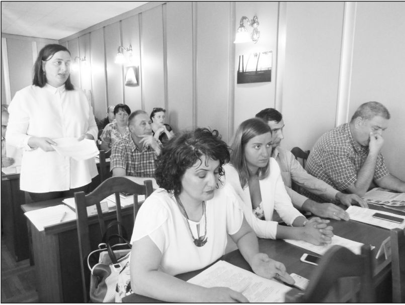
საკრებულოს თავმჯდომარის დაუსწრებლობის მიზეზი:

„ჩვენ ღაგვიანებით, მარამ თქვენ მალე აბრანდებით მავ სკამიდან“