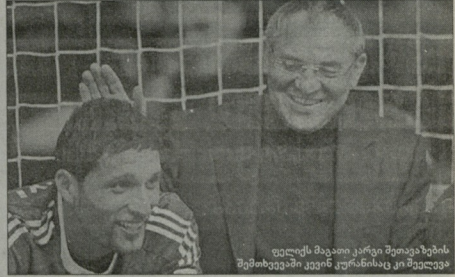
ფულიძის მაგათია კარი შეივად ზევის შემოხვევამ კვირს კურსასტყე მოკლდა

ბრაზილიელ ზე რობერტო, რომელიც „ზე რობერტო მორიდე“ მიიხსენიები ხოლმე (რადგან „მაგათი“ ზე რობერტო „პამპერტო“ თამაშობს), სამ-მოზილად დაბრუნდება დაგანია (მოკლდ, ეს ბრაზილიელი). აღსანიშნავია, რომ მას მაგათია კარვად არ იცნობს. სწორედ ამიტომ, ფულიძის ამბობს: „რადგან ფეხბურთელი უფლისციხის იქცევა, ეს ამისთვის ჩვევია და ყველამ კარვად იგი, რომ ამეგებს დასახლებავად ვერ ვიტან. მაგრამ მე არ შემიძლება სხვა რამეზე ვეფიქროვ. ადამიანი და კონკრეტულად ლაპარაკი, რადგან მას ფუტბორივად არ ვიცნობ. ვერ უნდა გავეცი, რადგან ლაპარაკი და მერე ვადავწყვეტ, როგორც არის.“ ამასთან, მისი გადაბრუნება არავის სურს.