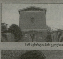
სან სებასტიანის ეკლესია