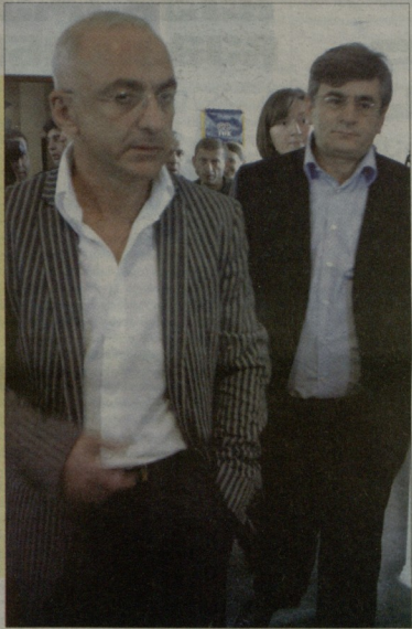
ინტერვიუ >> ბავრი 3

ფირცხალავა: ჯერ ამირჩიონ და მერა ვილპარაკოთ