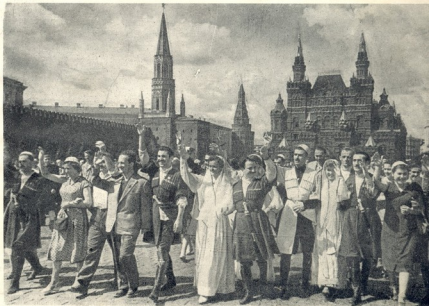
საქართველოს ახალგაზრდობის ფელაქაცია წითელ მივღანზე.