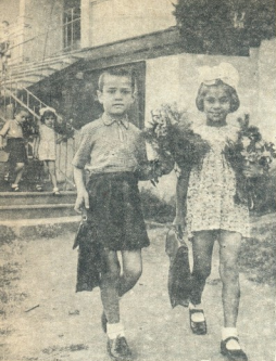
ამ პატარებს მფობრებმა—კოჯრის № 1 საბავშვო სახლის აღმზრდელებმა—თავივლები დაუტოვიდნ და ასე გაისტუმრეს სკოლისაკენ პირველ სტეპებებს.