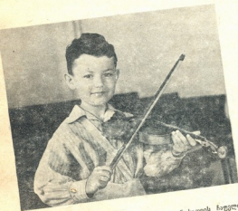
ეს თბავსუბა ბიჭუნა, ზელი რომ ეთოლინისათვის ჩაუღლია გიორგი ნიკოლოზოვა ოდნებ შესამჩნევი გამარჯვებულ ლიბილით გვიმრებებს იგი, თიკოს სურს გვიბრახს: აი, მე ეთოლინა მაჭეკ, თუმცა უბრა კარგად არც კი ვიცი როგორ დაეტიბოთ, მაგრამ ნაზვი, როგორც მეუსიკოსი გამოვლი!