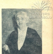
კოლექტივი ევრნალის სახეობა ქალის დაარსება ჩვენი წინხელის კიდევ ერთი მანქანებელია.

ევრნალის წინაშე დიდი და სერიოზული ამოცანებია დასაბული დარწმუნებული ვართ, რესპუბლიკის მოწინავე ქალთა გულითადი ატვირთი დასაბუნებრივად—მათი წარბილები, წინადადებანი, კრიტიკული შენიშვნები ხელს შეუწყობს საყვარელი კოლექტივი უფრო სინტეზის გახადოს ჩვენი ევრნალი.