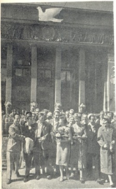
ქართული და დამსწერული სტილენ- ტები გაზეთ „პრაგმა“ რედაქციის კვლევან.

საქართველოს ფილიატების უკუფრა სირიისა და ის- ლანდიის ახალგაზრდობის წარმომადგენლებთან.