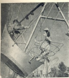
პატრიკი ტანაშაძე კარგია,