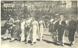
ფიტნამულ ქალთა დღეივანე ვაკის პარკში.