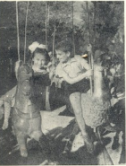
ტენუნებზე აწეულუბაჲც. მარკოშ...