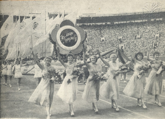
ახალგაზრდობისა და სტუდენტთა VI შრომითი ფესტივალის საზეი- მო გახსნა ე. ა. ლენინის სახელო- ბის ცენტრალურ სტადიონზე.