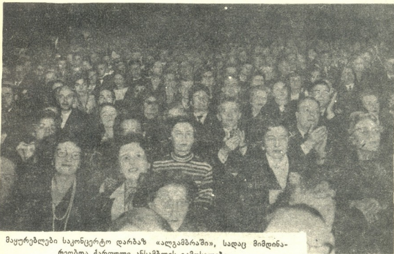
მეურბელები საკონცერტო დარბაზ «ალგამბრაში», სადაც მიმდინა- რობდა ქართული ანსამბლის გამოსვლება.

მანგარიშებული და აწყობილი, რომ ცველა- ზე უფრო ცხარე შეტაკებებსა და ცალკეულ ნომრების უსწრაფეს კალედოსკოპში დაკავს ნელდება ამ სასწაულმოქმედი ხელოვნების მე- ქანიზმისათვის თვალისდევნება. არაფერს არ შეუძლია ამ ნიღავეთან, ამ მწუხარ დისციპლინის ქარბუქთან ისეთი კონ- ტრასტის მოხდენა, როგორც მოცეცევე ქალ- თა მღორე მოძრაობებს, ქალებისა, რომლებიც ამ ფერხულში ფერიებიით დასრიალებენ..