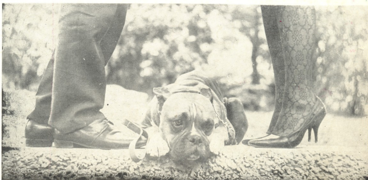
„აქლამი და მისი ბავშვი“