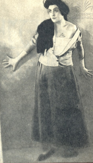
ლაურენია... ცხვინი წყარო

ეს ნათელი ნიჭის კეთილშობილი შემოქმედი სცენაზე შინაგანი წეის უშაღლეს თვიფასის საშუალებებით ავსებდა. როგორცია ძალა და სისადავე. ცხოვრებაში კი საყოფრად უშუალო, ბავშვურად მიამატი, ახლობელი და ამიღლევებლად საყვარელი იყო ყველასათვის.