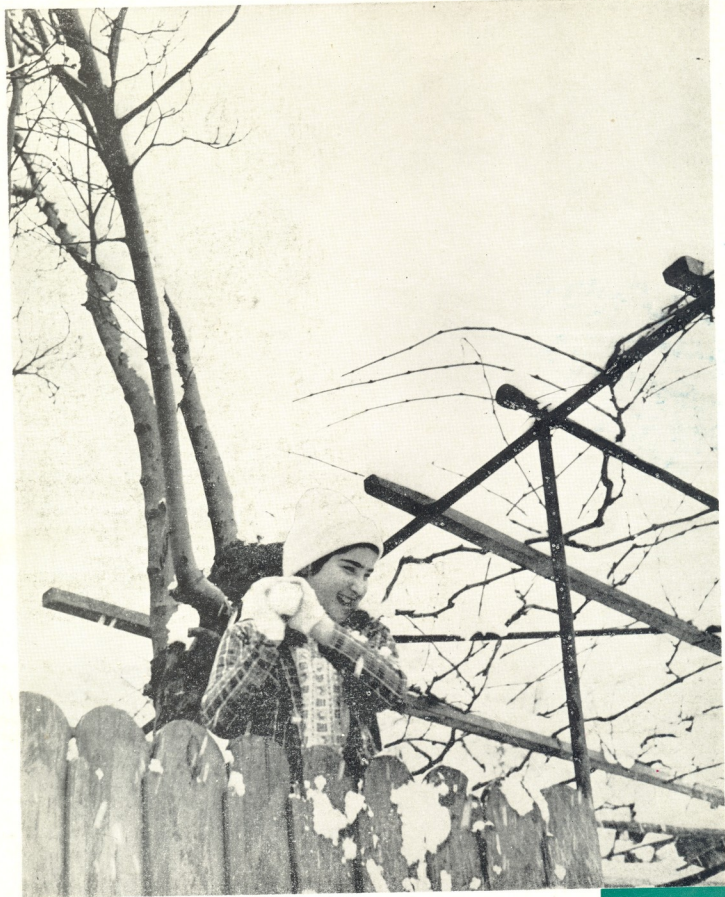
ფოტოგრაფიული ნოვა ანთიძის