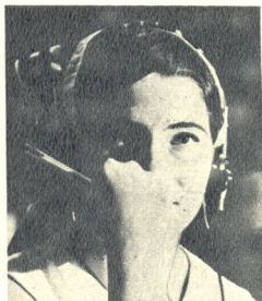
ახალგაზრდა ამერიკელი დეილეგატი