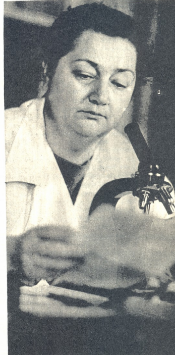
ნიხო ჯვანხმული, პროფესორი, მეცნიერ-თანამშრომელი, საქართველოს მეცნიერებათა აკადემიის წევრ-კორესპონდენტი, ხელოვნების დამსახურებული მკვლევარი.

ვასოკარი ენერგია აქვს ნიხო ჯვანხმ- ვილს. ინსტიტუტის ხელმძღვანელობასა და დადგნობივლ კვლევით მუშაობას იგი წვე- ბის მამძილუ მათიუფლად უთბესებს აქტი- ურ საზოგადობებრივ მოღვაწეობას. საქარ- თველბის უმღლესი საბჭოს დებუტარია; ათი