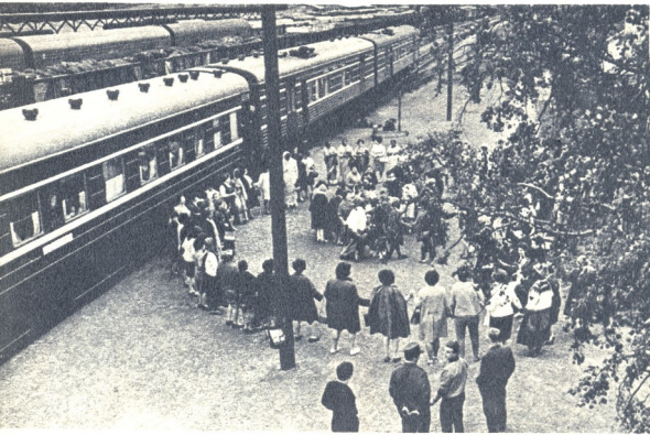
მეგობრობის ფერხული ვაინიკალს სადგურში

ამ მხრივ მნიშვნელოვან წარმატებად ჩა- ითვლება სხვადასხვა ქვეყნების კანონმდებ- ლობისა და საერთაშორისო ორგანიზაციებისა მიერ, მათს კონვენციებსა, დეკლარაციებსა