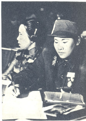
ვიტანამული გმირი კალი ანტ ტუ

„ნო, ნო, ნო!!! — ვევირით შემოფრთხილებულ- ნი კოლონიალიზმსა და ნეოკოლონიალიზმს, აგრესიას, რასიზმსა და დისკრიმინაციას დღეს, ამ წლებში სამეურნეო არ უნდა ქონდეს ადგილი, არა, არა, არა!