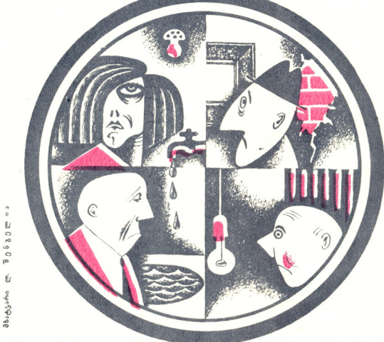
მ. ბ. 1988

— არა, მე მხედველობაში მაქვს ნათის ლამბის ვამონგნებელი ლუკასევიტი, ვისი ძეგლი დღესაც ამწვენი კარონისის მიწას. თუ ისეთი გამოჩინილი ამდამინი, როგორც ლუკასევიტი, სარგებლობდა ნათის ლამბით და თავს უხედნიერეს კაცად თვლიდა, მაშინ თქვენ, მოქალაქე სურია, — — მომიტყვეო, გთაყუცა, მე კი ვეცადა, მაგრამ შეგოვდამ თუ არა ლამუსი მაგიდა-