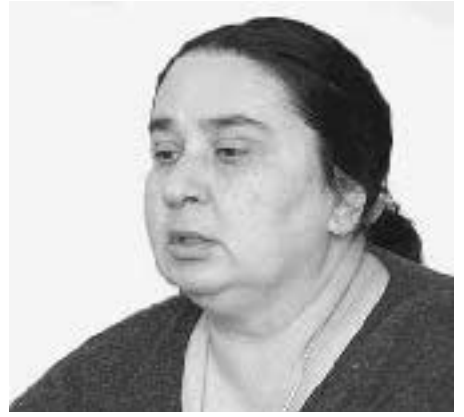
ერთიანდებიან და ერთ მაგიდასთან სხედან?

— უპირველეს ყოვლისა, ეს ღირსების საკითხია. „ნაციონალიზმს“ ფაშისძესაც ვერ დავარქმევ იმიტომ, რომ ამ უკანასკნელს გერმანელი ერი მაინც უყვარდა. ისინი ისეთივე სისასტიკეებს სჩადიოდნენ როგორც „ნაციონალიზმი“, მაგრამ თავისი ერი უყვარდათ და ამბობდნენ: ამ ბოროტებებს გერმანელი ერის საკეთილდღეოდ ვაკეთებთო.