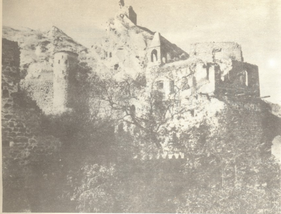
კლდედანიშვილი ისტორიული კვლევა