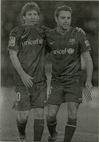
მესი და ჩაი, აბა, ჩვენ ვინ მოგვარება...

ზაბაძის და ლევის საბჭო წევრებს თანამა და საბჭო ილიდ დანი, არ დადებით უკან წრულზე დადგირაუბა 2-1-მა, ცხრა კაციო მოთამაშე ბარსელისა გოლი მსაყის მიერ დამატებულ მე-3 წრულზე გაუშვა, ისიც უსაღებო. ასე რომ, კლუბი შენარჩუნდა „ბარსელისა“ სულისანი უბრატკბაო საბჭო კლუბთან და უკანასკნელის მ-ტულანი პილიტაჟი „ვალენსისთან“. საბჭოებო გერბობებზე და კაპო წრულზე ანგარიშები მასმინიშნული სასარგებლო მე-5 წრულზე გაიხსნა, „მესტალიაში“ იმხან დადავინა - სამი წრული, შემდეგში თითქმის კრიტიკული სტატუსი განვიტოვებო მიუღწევინი შეუტანა. „ბატევისთან“ თამაშის წინ გარკვეულ რამა სპორტული დანი აღწევა არაყო მარცხდებლან, კლუბი სამი კვირა არ შეუტევა 2-1-მა თამაში, გვარდობდა დენი გრია აბილდაჟი არ შეუტევა 2-1-მა თამაში, გვარდობდა მსაყის მიერ დამატებულ მე-3 წრულზე სტუარტისა მარცხედა დასრულზე გადამარცხდა. მე-5 წრულზე სტუარტისა მარცხედა დასრულზე გადამარცხდა. მე-5 წრულზე სტუარტისა მარცხედა დასრულზე გადამარცხდა.