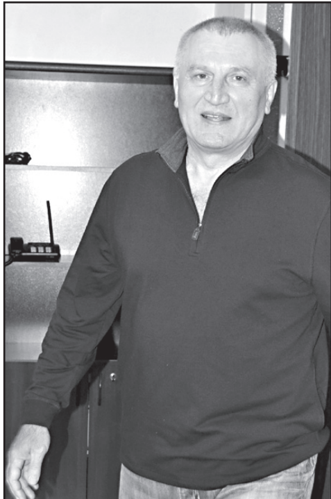
145 დოლარი ღირდა ბარელი, მაშინ არ იყო ასეთი ფასები საქართველოში. ახლა კი მხოლოდ შიდა ფაქტორების გამო ასეთი მასშტაბის ცვლილებები და არა – გარე ფაქტორების გამო.

– არანაირი ძვირი ფასები დღეს ნავთობზე არ არის. ნორმალური ფასებია. მაშინ, როდესაც