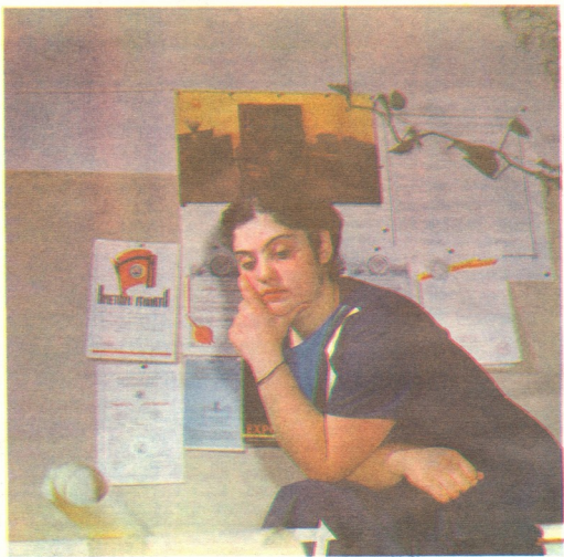
საბჭოთა საბჭოთა საბჭოთა

„თამრიკოს დიზა“, — ასე ჰქვია პატარა შაქტის, რომელიც უკვე წარმოებაში იქცევა... შაქტის სურათი გოგონას მშობლებმა შაჩუქეს. თვითონ ძუნწი მოსაუბრება, არ უყვარს თავის თავზე ლაპარაკი. არადა, მის მიერ მოფიჭებულმა ხის ბურთულაკების დამამუშავებელმა დაზღვა გოგონას პირველი სისხარული ჯერ კიდევ შეეჭვებ კლასში მოტანა.