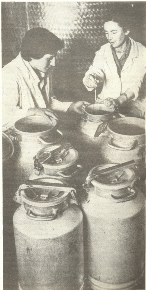
● ლახიანტი აინი, კახანა და მქეილაი ნანული ხალაიჭული

კორბოული ტერიტორიით, მოსახლეობის ოდენობითა და ეკონომიკით საჩხერის რაიონის ერთ-ერთი ყველაზე დიდი და მძლავრი სოფელია. ახალმა მეცხოველეობის კომპლექსმა, რომელიც 1983 წლის ივლისში შეემატა ადრინდელ მეცხოველეობის საბჭოთა მეურნეობას, კიდევ უფრო მძლავრი გახდა სოფელი. ამჟამად მის წილად მოდის რაიონში წარმოებული ხორბლის 55 პროცენტი, სიმინდის 40 პროცენტი, პირუტყვის საკვებპროდუქტების 35 პროცენტი. მომავალში კომპლექსი სრულ სიმძლავრეში შევა და 2400 ტონა რძეს აწარმოებს, რაც თითქმის გაუტროლდება რაიონში 1986 წელს წარმოებულ რძის გეგმას. (2500 ტონას).