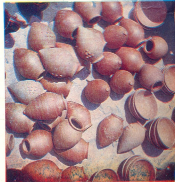
შპანი ან ძველი,