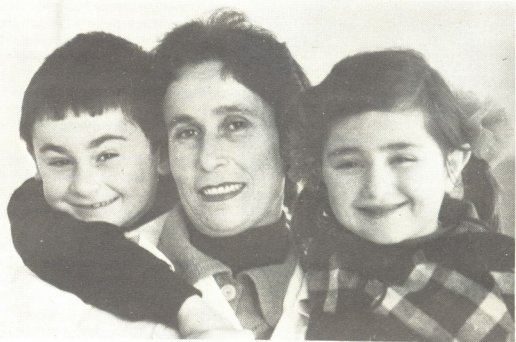
ჩვენ ბავშვთა სახლიდან ვართ