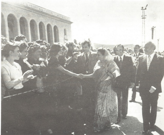
ინფორმაციის დღის სტუმრობა თბილისში

ინფორმაციის დიდებული წინაპრები უკავდა: ბაბუა - მოტივალ ნურს, ინფორმაციის ერო- ვნული კონგრესის პარტიის „სველი გვარ- დიის“ წარმომადგენელი ვახლათი, მებრძო- სვარს რანი ნურს, ანტიბრიტანულ მანი- ფესტაციებში მონაწილეობდა, დედა - ქა- მილი და მამა ჯავახიშვილი ნურს აქტიუ- რად იმართდნენ ინფორმაციის ეროვნული და- მოუკიდებლობისათვის. მათი ბიძა დამო- უკიდებელი ინფორმაციის მებრძოლ თავ- კაცი თევზყვარი შტატი იყო. სწორად აპირებდნენ დედ-მამას, მათ თავს ესხ- მოდნენ პოლიციელები. მარტო დარჩენილ ბავშვს ახლოდღეობა ზრდიდნენ. ამიტომ, ინ- ფორმაციის დროგამოშვებით სწავლობდა. მას ამ- სწავლება საპრობლემატიანი გამოვლენილი ბარათები: „თავ მამაცი და ყველაფერი მო- გადრდება“.