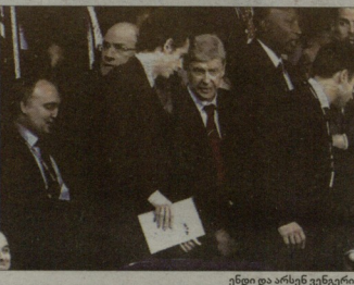
ენდი და არსენ ვენგერი