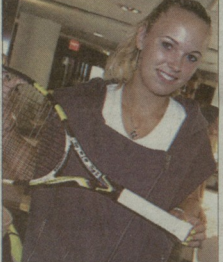
კონსტანცია როვანი პირადი დასახლება

2003 წელს ერთმა ინგლისელმა სპორტსმენმა მისი საქველმოქმედო აქტივების განხორციელების მიზანმიმართული დაფინანსების სახელით, მისი განცხადებით, საჭიროა იმ პირობებში, როდესაც ოჯახი აღარ აქვს შესაძლებლობა დაეხმოს პენსიონატის მოვლაში.