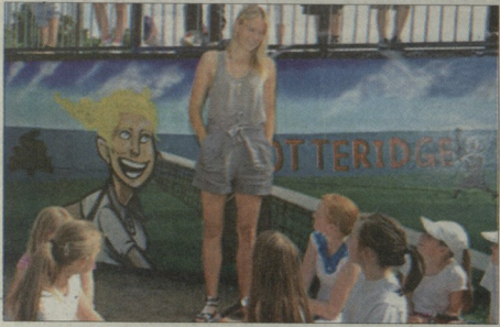
მარია ბაგუთა ცენტრი