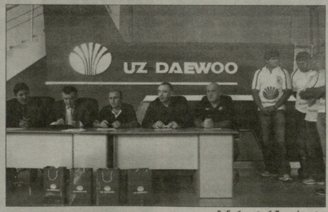
ლელო პირველ ადვოკატს დაბრუნდა.

ამ ეტაპზე წვენი საერთო მიზანსა, უფლებებს ლელოს კვანძიანი მიიღეს, სამსხივად გულს ცვლილანად გვატარა.