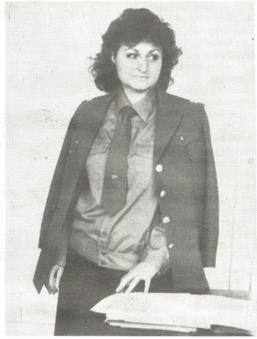
● სააუნა ელერდემელი